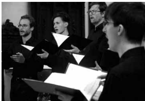
Ensemble Versus.

Jen čtyři dny po letním slunovratu, v pondělí 24. července večer, se v rámci Forfestu v Chrámu sv. Mořice uskutečnil koncert brněnského souboru Ensemble Versus , komorního souboru studentů brněnské Filozofické fakulty Masarykovy univerzity. Program s odkazem na Hod Boží Svatodušní nazvali Letnice v soudobé hudbě.