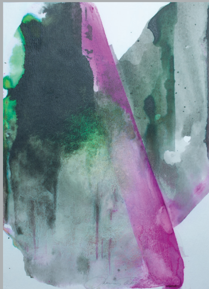
DAGMAR JAHODOVÁ Proměna I. 2020, akvarel, tuš na papíře, 30 x 21 cm