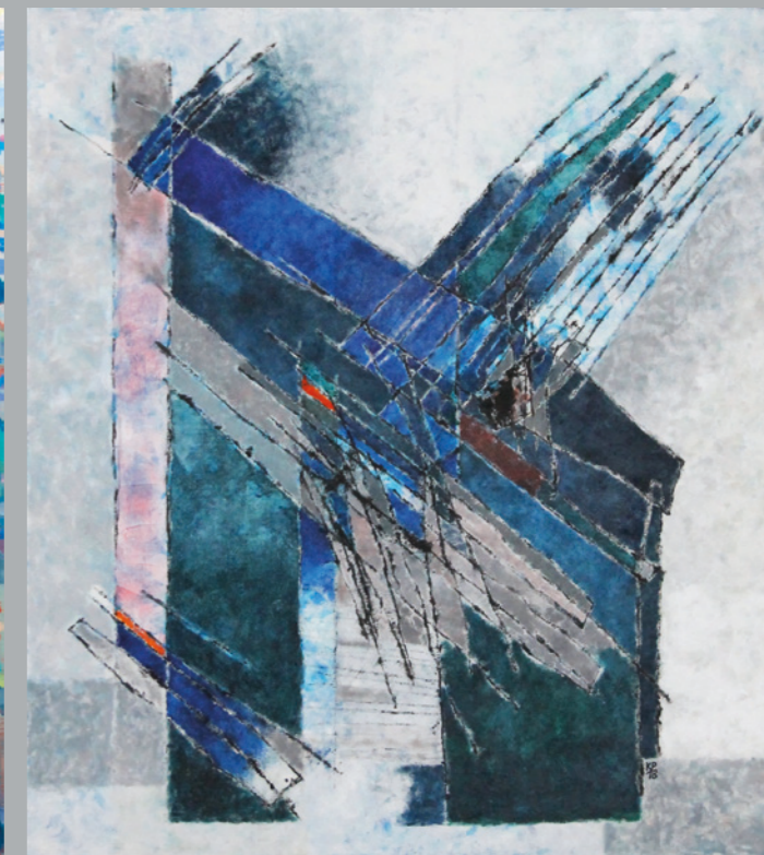
KAREL PRÁŠEK Hledání tvaru, 2017, akryl na plátně, 95 x 85 cm