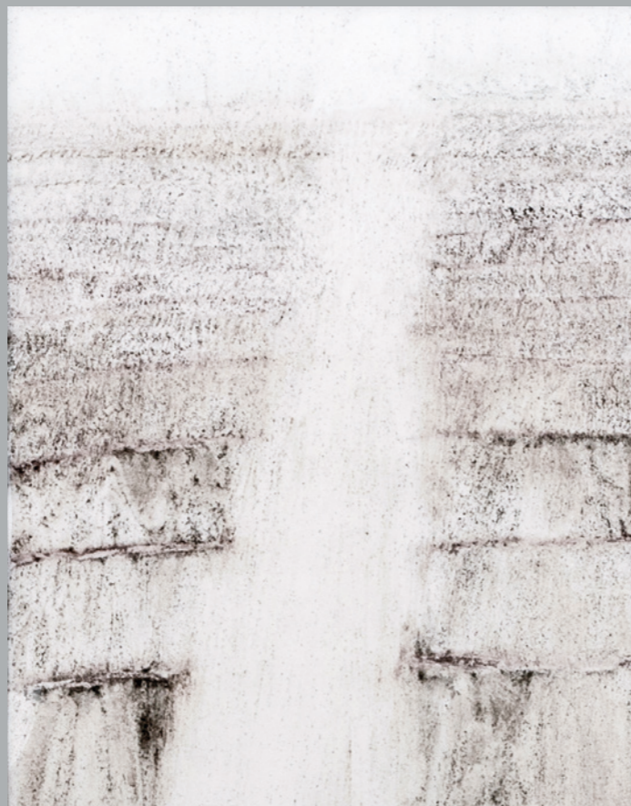
MARIANNA PETRŮ Island, 2019, pigmenty na papíře, 40 x 30 cm