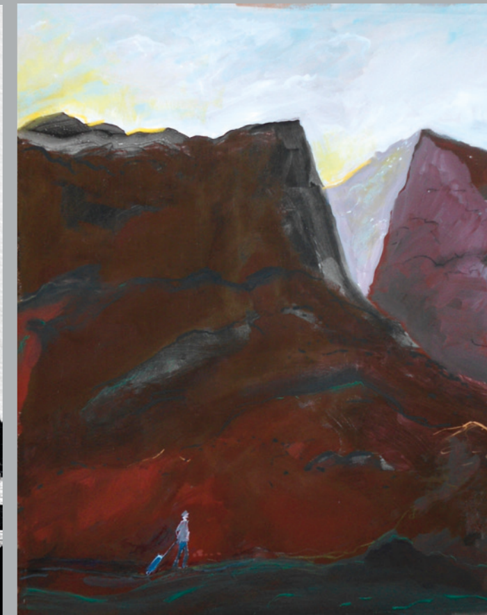
TILMAN ROTHERMEL Der Pass / Průsmyk, 2015, malba na papíře, 54 x 44 cm